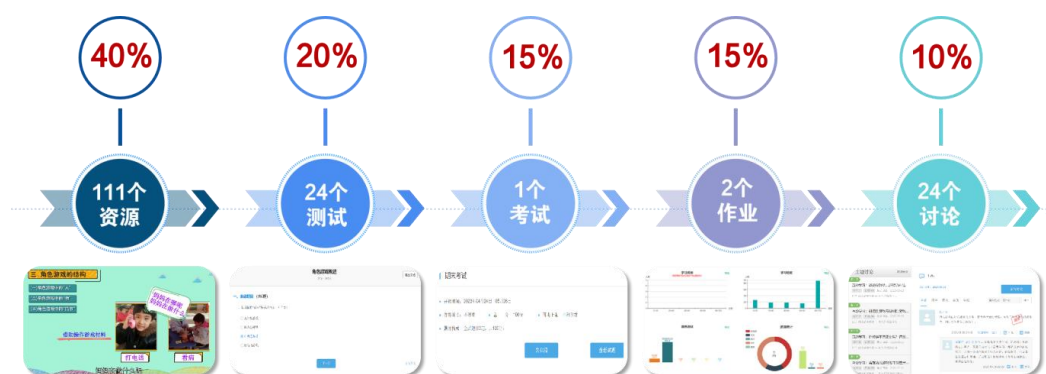
图 4 课程考核占比

以《学前教育专业认证标准》和《学前教育专业师范生教师职业能力标准（试行）》为基础，创设 162 个信息收集指标，强调过程评价和总结评价相结合、基础理论考核评价与综合素质评价相结合、学习态度评价和学习效果评价相结合，构建“多元多维多方”动态自适应的考核评价体系，全面实现面向产出的评价机制。课程有 111 个资源、24 个在线测试、1 个终结性考试、2 个作业和 23 个主题讨论，资源完成率占课程考核的 40%，终结性考试占考核的 20%，作业占考核的 15%，在线测试占考核的 15%以及主题讨论占考核的 10%。在课程考核中，0-60 分为不及格，60-80 分为及格，80 分以上为优秀。