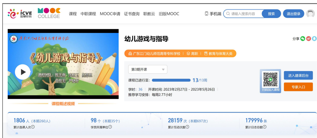
图1 《幼儿游戏与指导》精品在线开放课程平台

《幼儿游戏与指导》是高职高专学前教育专业的一门理实一体化的核心课程，也是我校学前教育专业在大学三年级开始的必修课程，以幼儿游戏基本理论为基础，创设角色游戏、结构游戏、表演游戏、智力游戏、体育游戏、音乐游戏、民间游戏和安吉游戏八大幼儿游戏实操项目。通过学习八类幼儿游戏的概述、组织、指导和评价四大知识要点，结合幼儿园真实视频案例观摩与分析，培养“满足游戏需要，创设游戏环境，支持幼儿游戏”的岗位核心能力，精准指向专业“厚基础、强能力、精特长”的培养目标。